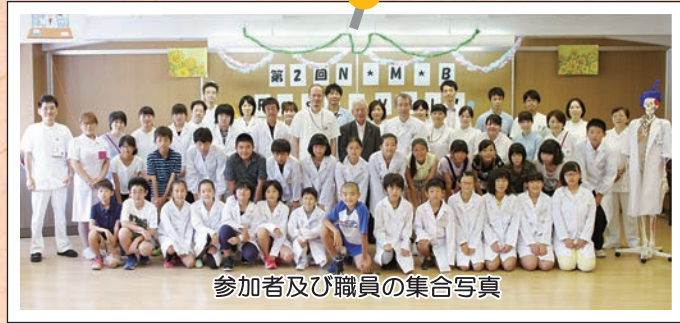
参加者及び職員の集合写真

いて切開縫合体験や腹腔鏡体験を行いました。中には難しい作業もありましたが、参加者は集中して、また時には笑顔を見せながら体験に取り組んでいました。