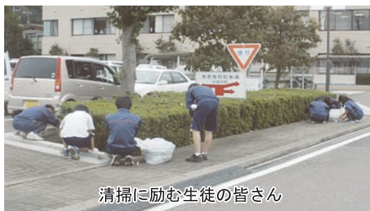
清掃に励む生徒の皆さん

この活動は烏山高等学校創立記念日の奉仕活動の一環で行われたもので、駐車場の草むしりやゴミ拾いをしていただきました。すみずみまで清掃をしていただいたおかげで、駐車場はとってもきれいになりました。皆さんのご協力、誠にありがとうございました。