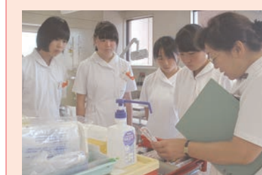
那須烏山市内の中学生6名が職場体験で、病院で働く職員の仕事を体験しました。