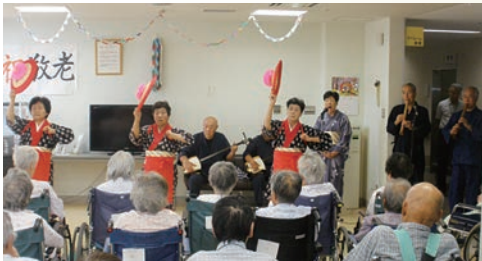
山形県の民謡「花笠音頭」の演奏と踊り

また、演奏に合わせて踊りも披露していただき、見学に来られた患者さんは演奏だけでなく、踊りにも釘づけになっていました。