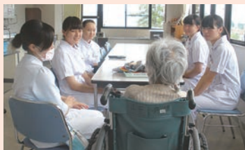
ふれあい看護体験は、体験をとおして看護職の確保に繋げることを目的に実施しており、今回は9名の高校生が参加しました。