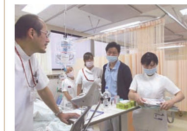
病棟のラウンド風景

看護部では、「ふれあい看護体験」及び「職場体験」を実施し、県内の中高生が参加しました。参加者は白衣に着替えて、多くの患者さんと触れ合っていたいただき、看護師の仕事に対する興味をより一層深めていただくことができました。